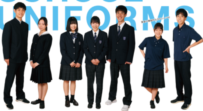
従来の制服(詰襟・セーラー)